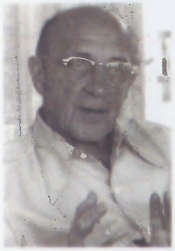
Carl R. Rogers, 1902-1987

L'apprentissage de l'écoute active repose sur la mise en situation des participants dans un climat d'authenticité, d'empathie et de non-jugement.